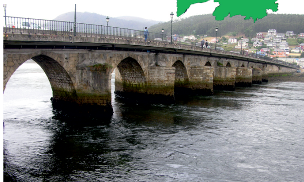
Ponte medieval de Viveiro, no esteiro do Landro.