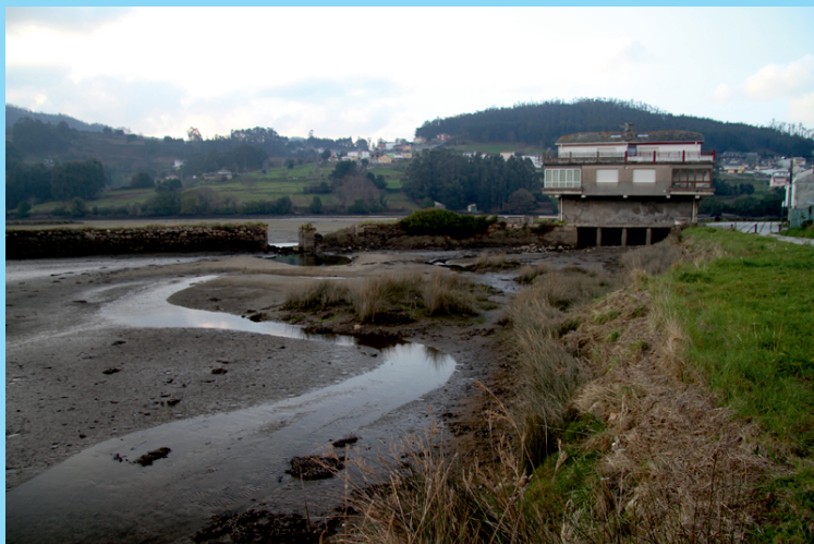
As Aceñas dos "Verxeles", muíño de marea convertido en vivenda.