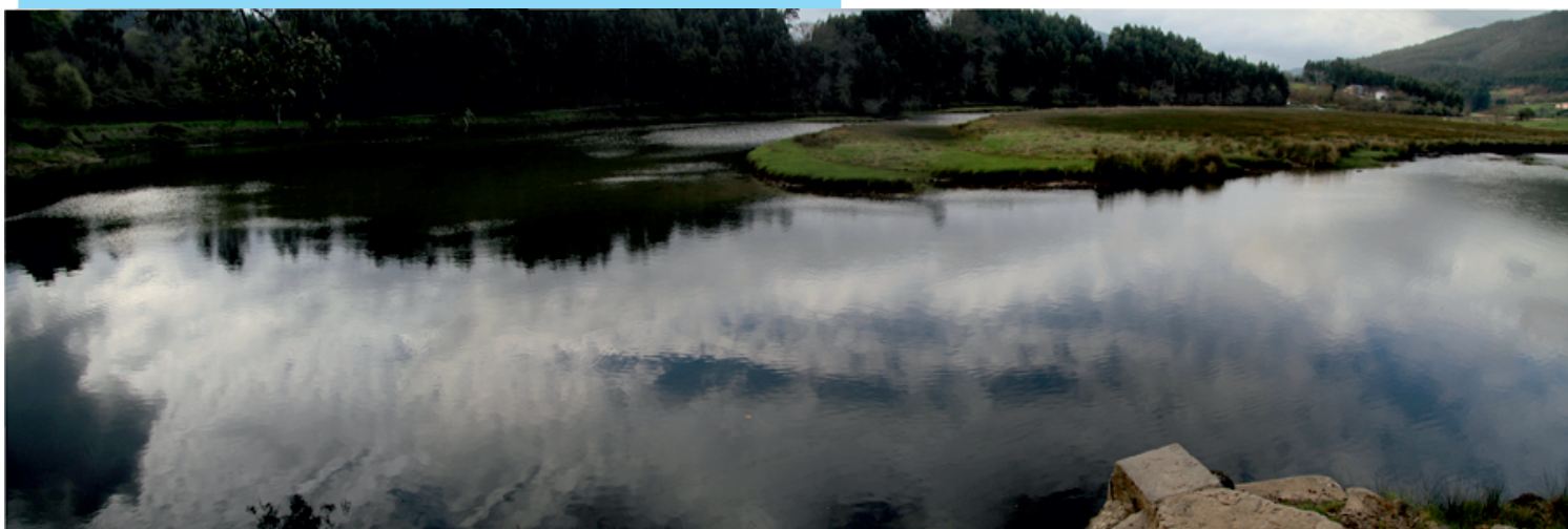
Panorámica na zona do Pozo do Piago.