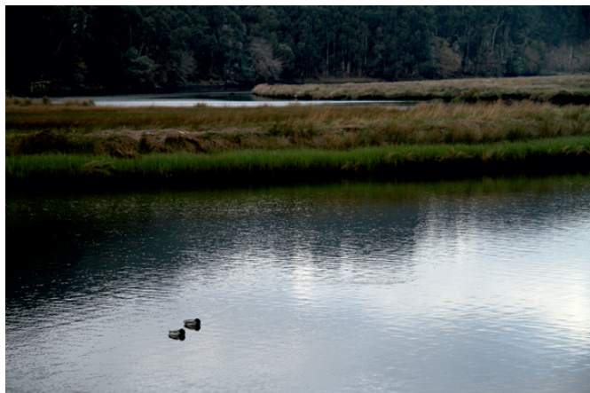
Lavancos e xuncos.